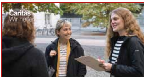
Haussammlung mehr als eine Spenden-Sammelaktion www.caritas-tirol.at