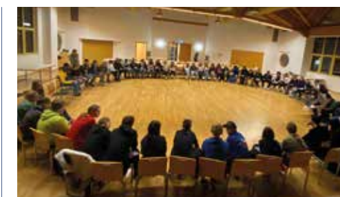
Starttreffen aller Firmlinge am 18. November 2022

Die nächsten Schritte sind die weiteren fünf Module der spiricloud, eine digitale Versöhnungswoche mit abschließender gemeinsamer Versöhnungsfeier für alle und ein Erlebnismittag in Matriei.